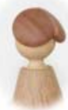
見えないところまで、丁寧に細工を施した。